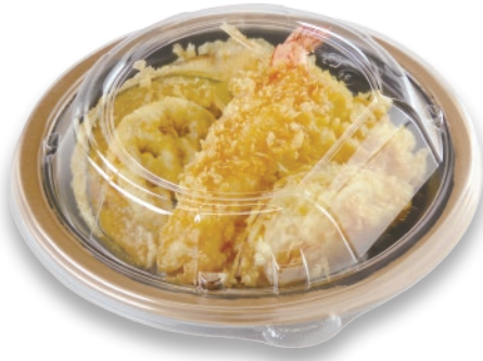
天丼 TA R-DON M19 RING