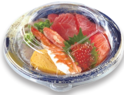
海鮮丼 TA R-DON M18 FLO B