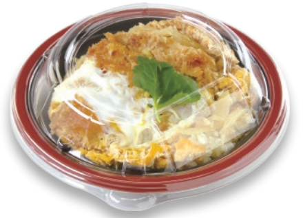
カツ丼 TA R-DON M18 RIN R