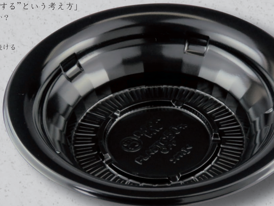
TA R-DON M18 BK