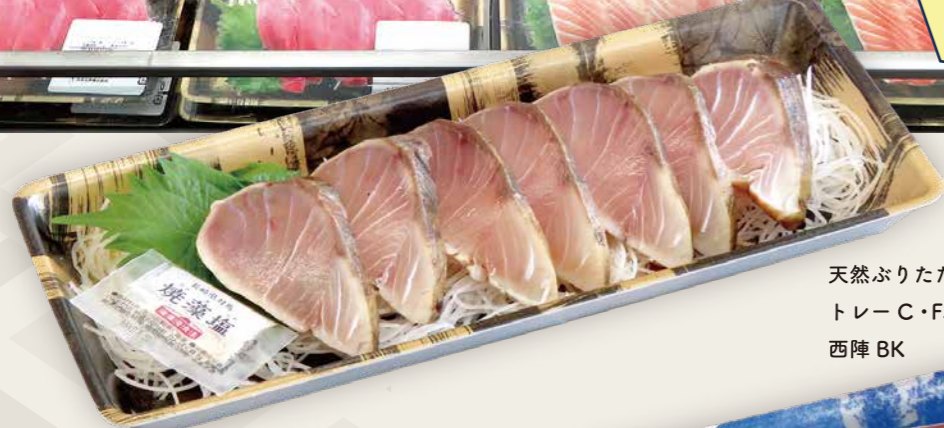
天然ぶりたたきお造り トレー C・FS-L2E 西陣 BK