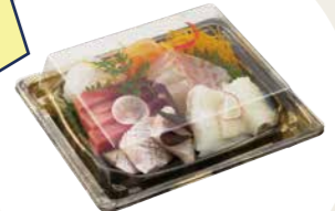
BCF 宝台 20-17 西陣 BK-BK