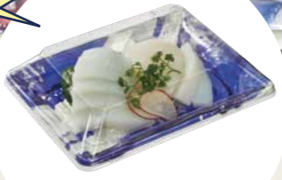
C-AP みずず 20-15 つらら B