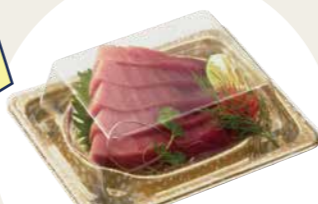
BCF 宝台 15-12 風光 G-BK