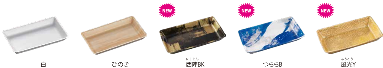
白 ひのき にしじん西陣BK つららB ふうこう風光Y