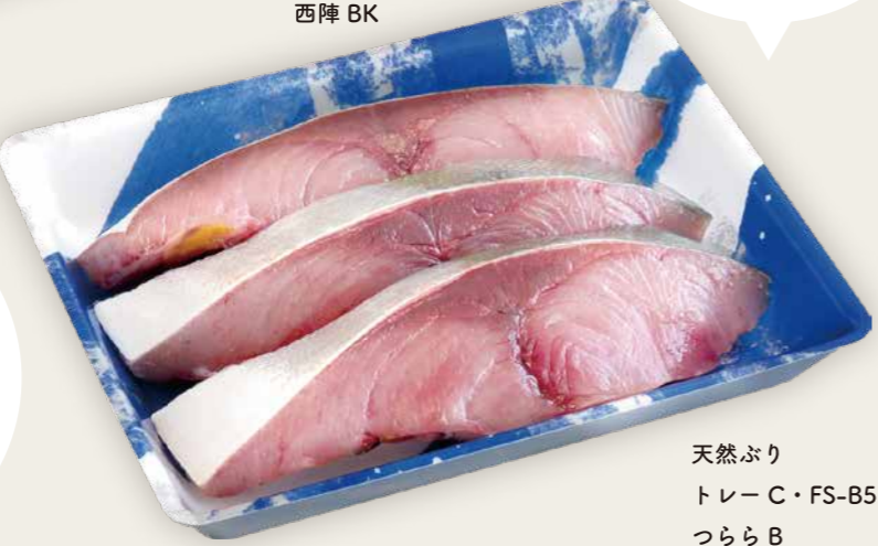
天然ぶり トレー C・FS-B5F つらら B