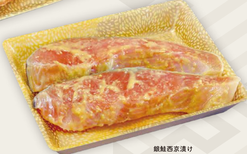
銀鮭西京漬け トレー C・FS-B5F 風光 Y