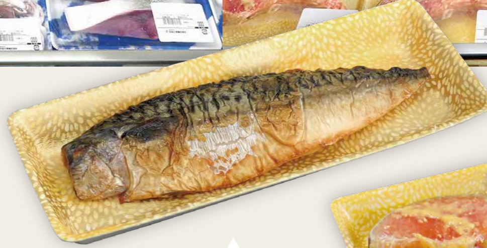
焼き塩さば トレー C・FS-L2E 風光 Y