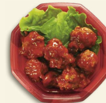
ヤンニョムチキン TP オルマ八角 18 フラム R