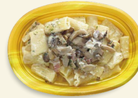
きのこクリームペンネ TP オルマ M25-18 ベジ-Y