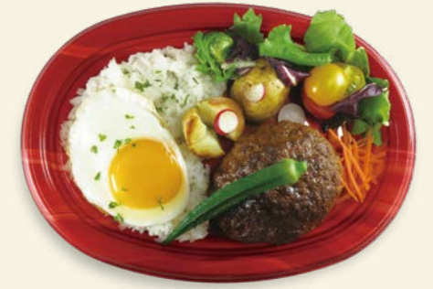
ハンバーグプレート TP オルマ M25-18 ベジ-R