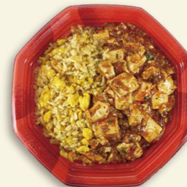
麻婆炒飯 TP オルマ八角 21 フラム R