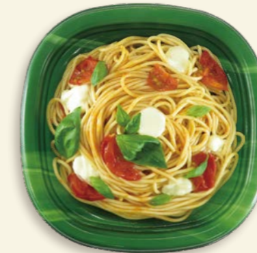
トマトとモッツァレラチーズの Pasta TP オルマ K21 ベジ-GN