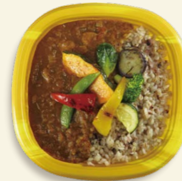
彩り野菜カレー TP オルマ K21 ベジ-Y