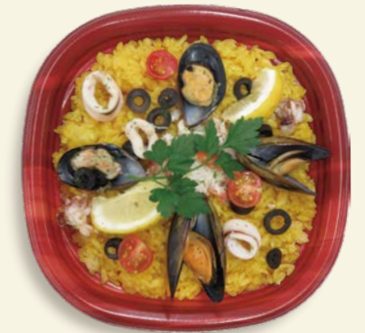
パエリア TP オルマ K21 ベジ-R