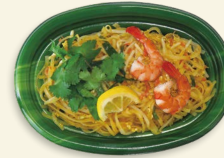
トムヤムパッタイ TP オルマ M25-18 ベジ-GN