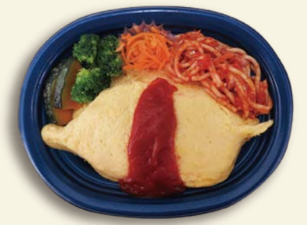
オムライス TP オルマ M22-17 紺