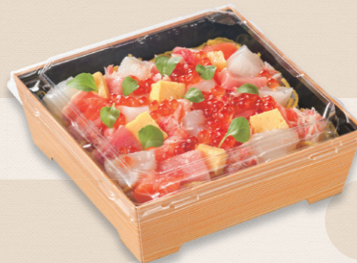
海鮮ちらし寿司 SKS 13-13(43) 黒-木曾 / 浅蓋