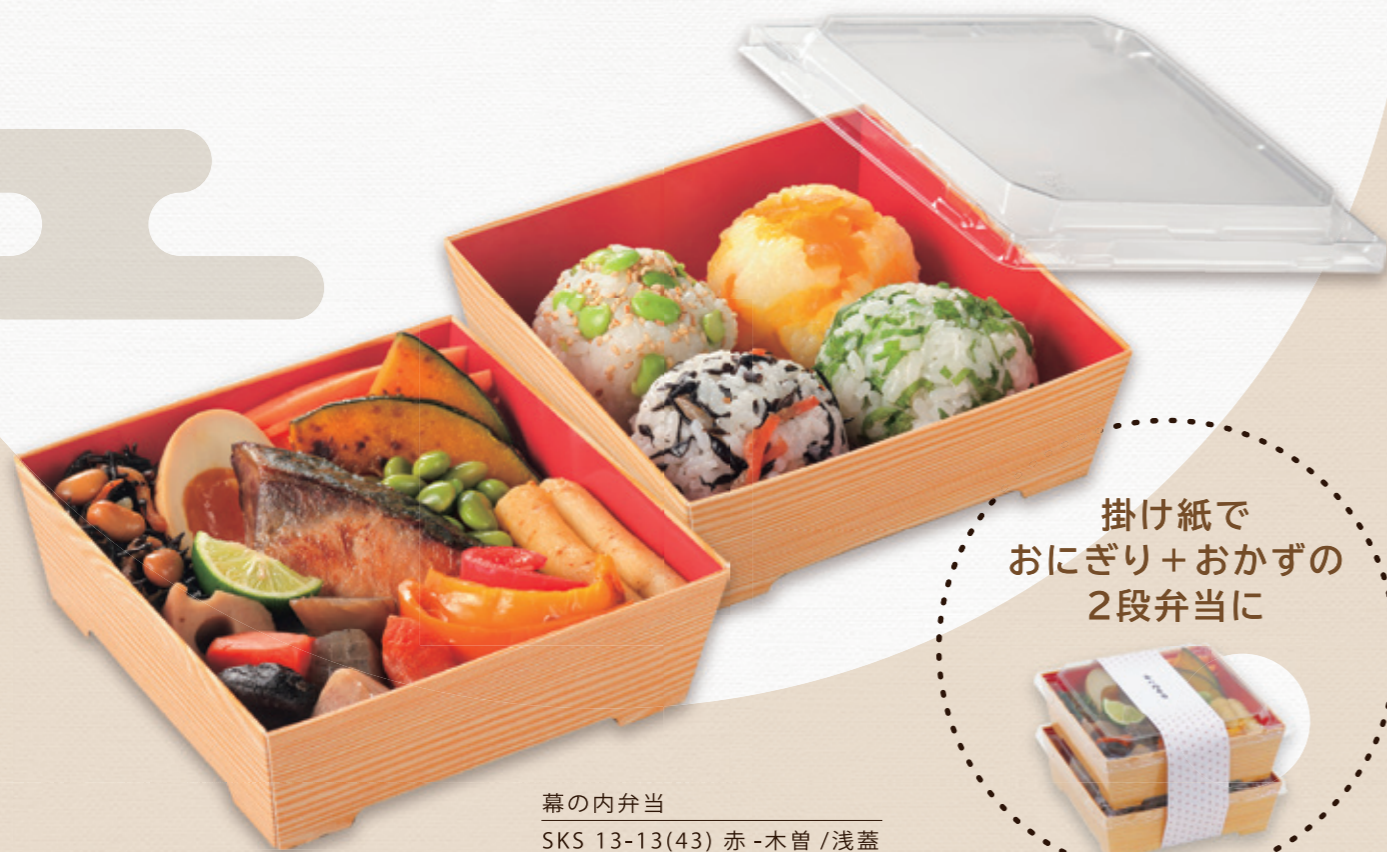
幕の内弁当 SKS 13-13(43) 赤-木曾 / 浅蓋