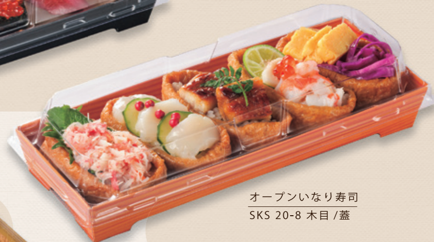
オープンいなり寿司 SKS 20-8 木目 / 蓋