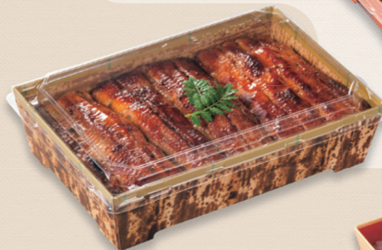
うな重 SKS 17-12(43) 竹皮 / 浅蓋