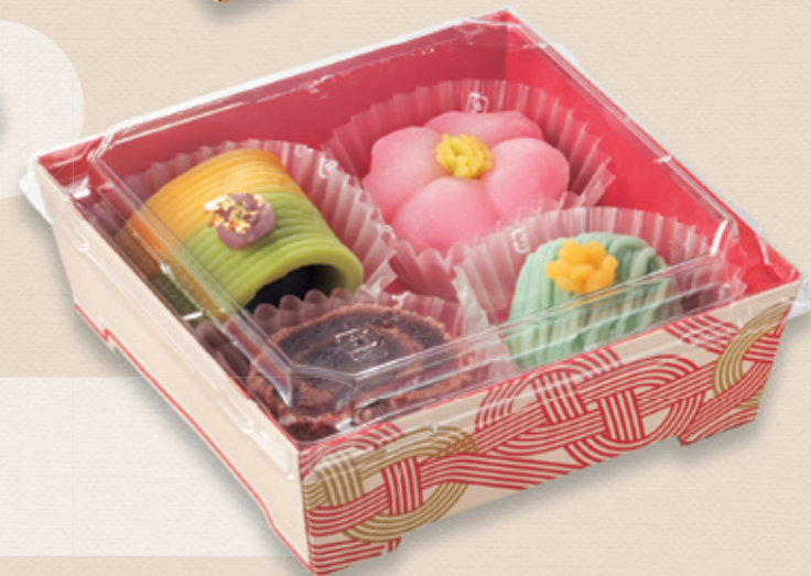
和菓子セット SKS 13-13(43) 赤-水引 / 浅蓋