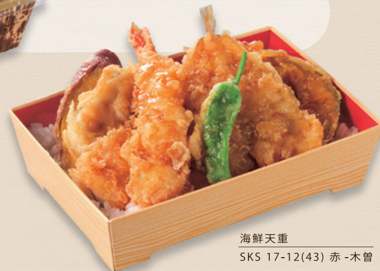
海鮮天重 SKS 17-12(43) 赤-木曾