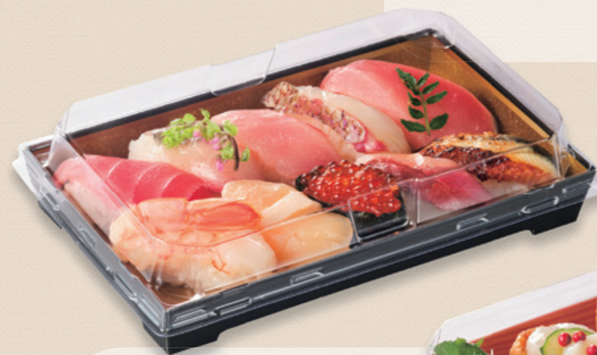
上にぎり寿司10貫 SKS 20-12 金箔-黒 / 蓋